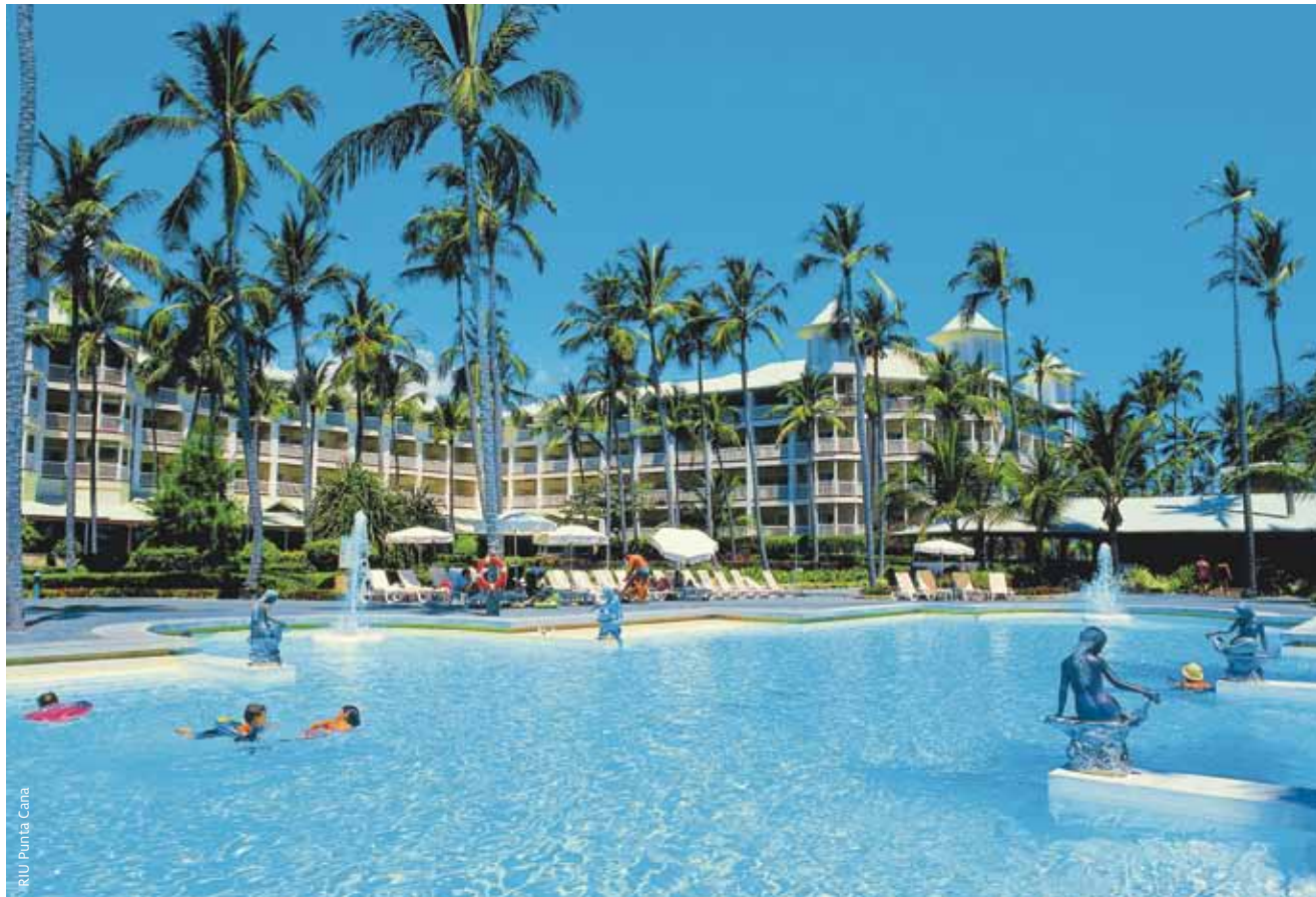
RIU Punta Cana

inclusive program. Plus, with its huge convention center, which includes four function rooms and has a capacity of up to 1,000 people, Riu Palace Bavaro is likely to become a hot spot for conventions and events.